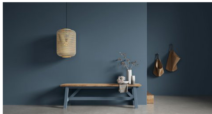
Kreidefarben für die Wand verbinden ökologische Verantwortung mit einem ästhetisch ansprechenden Look.

(djd). Umweltbewusstsein und ein nachhaltiger Lebensstil sind in der Mitte der Gesellschaft angekommen. Immer mehr Menschen entscheiden sich laut Statista für qualitativ hochwertige Produkte mit einem ökologischen Mehrwert. Die Schöner Wohnen Naturell Kreidefarben bringen für das Zuhause sowohl Nachhaltigkeit als auch Ästhetik auf einen gemeinsamen Nenner. Die Farben für Wände und Möbel basieren auf einer veganen Rezeptur aus natürlicher Kreide, Porzellanerde und hochwertigen Pigmenten sowie einem Bindemittel, das zu 100 Prozent aus nachwachsenden Rohstoffen besteht (nach dem Massenbilanzverfahren). Die 20 Farbtöne sind von der Natur inspiriert. Sie trocknen schnell, haben eine hohe Deckkraft, sind leicht zu verarbeiten und schaffen pudermatte und abriebbeständige Oberflächen.