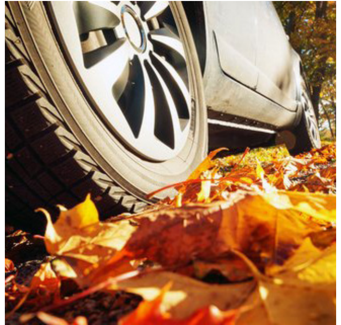
Wenn im Herbst die Fahrbahnen mit Feuchtigkeit und Laub rutschig werden, müssen Reifen, Wischerblätter und Beleuchtung top in Schuss sein.

Spätestens ab Oktober sollten die Sommerreifen gegen winterliche Bereifung ausgetauscht werden, da sie bei niedrigen Temperaturen mehr Grip zur Fahrbahn halten. Beim Reifenwechsel kann die Werkstatt den Zustand der Winterreifen prüfen: Liegt das Restprofil noch bei mindestens drei Millimetern? Sind die Pneus schadenfrei? Gerade im Herbst und Winter auf Fahrbahnen mit Nässe, Raureif oder Eis ist ein perfekter Zustand besonders wichtig.