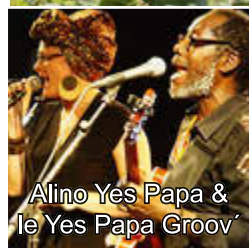
Alino Yes Papa & le Yes Papa Groov'

Fr. 04.08. 18.00 Uhr Konzert der Reihe „Naturklänge“ Einlass 19.00 Uhr Gartenkonzert & Lesung „fortgeschritten“ - Gunther Emmerlich mit dem Dresden-Swing-Quartett (Dresden) Genießen Sie ein Menü aus Erlebten und Gedachten mit einer Brise Erkenntnis und Selbstironie mit ernstem Anliegen und doch augenzwinkernd mit launigem Swing und Blues serviert Ein sommerliches Grillbuffet mit Bier vom Fass und Mixgetränken runden den Abend ab