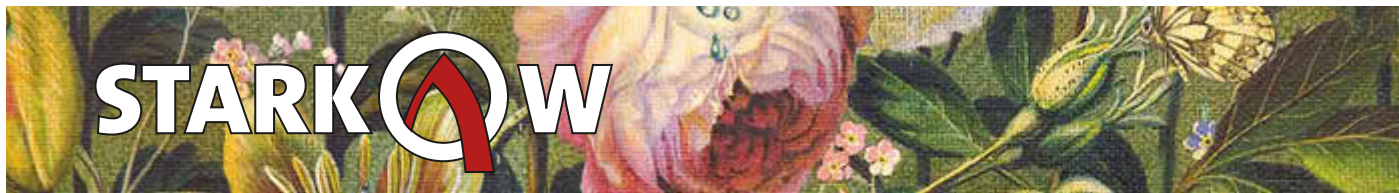
Titelbild von Künstler Jesko Donst