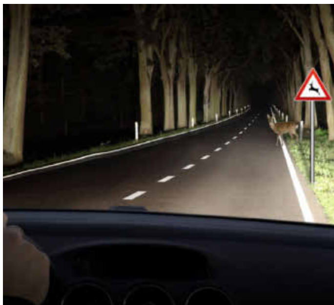
Vorsicht, Wildwechsel! Gut eingestellte Scheinwerfer sorgen für mehr Sicherheit in der dunklen Jahreszeit.

(djd). Mit der dunklen Jahreszeit und nasskalten Witterungsverhältnissen nehmen wieder die Risiken im Straßenverkehr zu. Wichtig ist jetzt eine gute Sicht. Doch an gut jedem dritten Auto sind die Scheinwerfer laut Statista entweder defekt oder falsch eingestellt. Viele Werkstätten beteiligen sich an den Aktionswochen und bieten eine kostenfreie Überprüfung der Fahrzeugbeleuchtung an. Das ist gleichzeitig eine gute Gelegenheit, um einen Herbstcheck für das Fahrzeug vornehmen zu lassen. Neben der Beleuchtung und frischen Scheibenwischern kommt es bei schwierigen Straßenverhältnissen ebenso auf die richtige Bereifung, auf Bremsen, Batterie, Motor und die Fahrzeugelektronik an. Unter www.boschcarservice.de etwa finden Autofahrer Adressen von Fachbetrieben aus der eigenen Region.