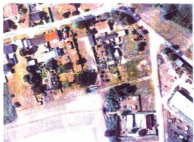
Luftbild (Sommer 2018)

Nach der Beschlussfassung zur Aufstellung der Satzung nach § 34 Abs. 4 Satz 1 Nr. 3 BauGB wird diese beim Amt für Raumordnung und Landesplanung angezeigt.