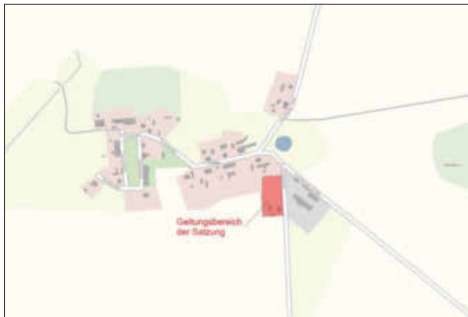
Übersichtsplan mit Räumlichen Geltungsbereich der Satzung

Entsprechend ihrer Bedeutung hat die Gemeinde ein bedarfsgerechtes Angebot an Siedlungsflächen zur Sicherung und Stärkung ihrer Funktionen unter Beachtung der städtebaulichen Strukturen bereitzustellen. Das Plangebiet stellt eine unbeplante Fläche im Außenbereich dar, sodass ein Planungserfordernis besteht. Damit wird auch ein Beitrag zur Entwicklung der Gemeinde Millienhagen-Oebelitz geleistet. Das Plangebiet ist über die Straße „Zur Eichenallee“ erschlossen und hat eine Fläche von 4.849 m 2