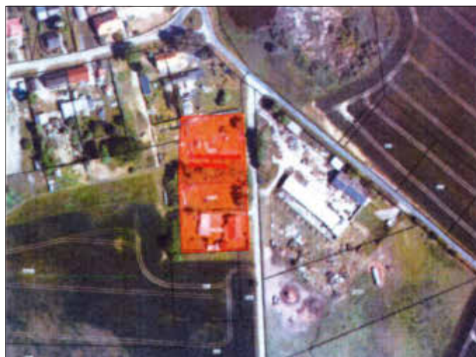
Luftbild mit Räumlichen Geltungsbereich der Satzung

Die Gemeindevertretung Millienhagen-Oebelitz hat in ihrer Sitzung am 24.04.2019 beschlossen, die Satzung nach § 34 Abs. 4 Satz 1 Nr. 3 BauGB „Bebauung Oebelitz - Zur Eichenallee“ aufzustellen. Ziel ist es, die geplante bauliche Entwicklung in diesem Bereich der Eichenallee städtebaulich zu ordnen. Die Gemeinde Millienhagen-Oebelitz beabsichtigt, für das Plangebiet südlich der Franzburger Straße und westlich Straße „Zur Eichenallee“ im Ortsteil Oebelitz, auf den Flurstücken 252/1, 252/2, und 253/1 der Flur 1 der Gemarkung Oebelitz die Satzung nach § 34 Abs. 4 Satz 1 Nr. 3 BauGB „Bebauung Oebelitz - Zur Eichenallee“ der Gemeinde Millienhagen-Oebelitz zu erlassen und diese Außenbereichsfläche in den im Zusammenhang bebauten Ortsteil einzubeziehen. Die einbezogene Fläche ist durch die bauliche Nutzung des angrenzenden Bereichs entsprechend geprägt.