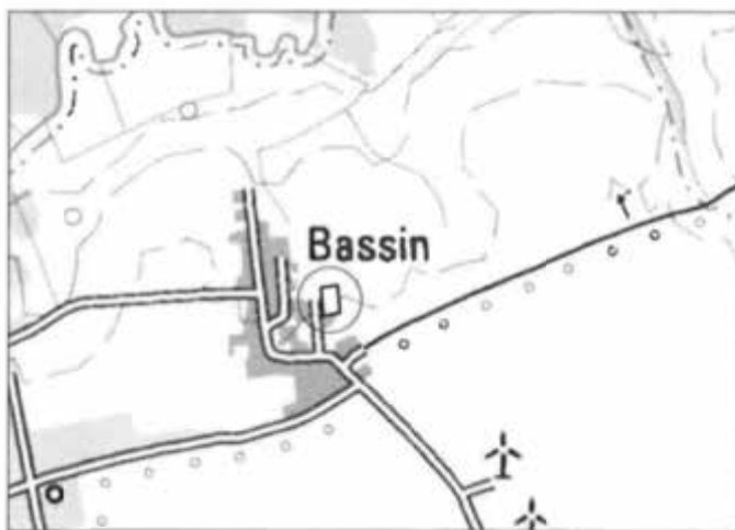
Übersichtsplän © GeoBasis-DEIM-V 2012

Gemeinde Wendisch Baggendorf Landkreis Vorpommern-Rügen