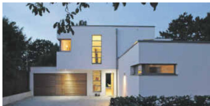
Dynamisches Duo: Für dieses Einfamilienhaus im Stil der klassischen Moderne kamen Kalksandstein und Porenbeton zum Einsatz.

(djd). Die Studie einer großen Bausparkasse ergab: Der Wunsch nach dem Erwerb einer Immobilie wurde bei fast einem Drittel der Mieter in Deutschland über den vergangenen Sommer hinweg deutlich größer. Sie wünschen sich mehr Platz für die ganze Familie, einen Ort zum Arbeiten, für die Kinder zum Spielen oder auch um einmal nur für sich zu sein. Diese Bauherren in spe wollen vor allem bezahlbar bauen. Dazu wohngesund und flexibel genug, um auf neue Situationen reagieren zu können, etwa mit einem Um- oder Anbau. „Massives Mauerwerk beispielsweise erfüllt diese Anforderungen bestmöglich“, erklärt Dr. Ronald Rast, Geschäftsführer der Deutschen Gesellschaft für Mauerwerks- und Wohnungsbau (DGfM). Mehr Infos zur Massivbauweise gibt es etwa auf www.mauerwerk.online und www.massiv-mein-haus.de .