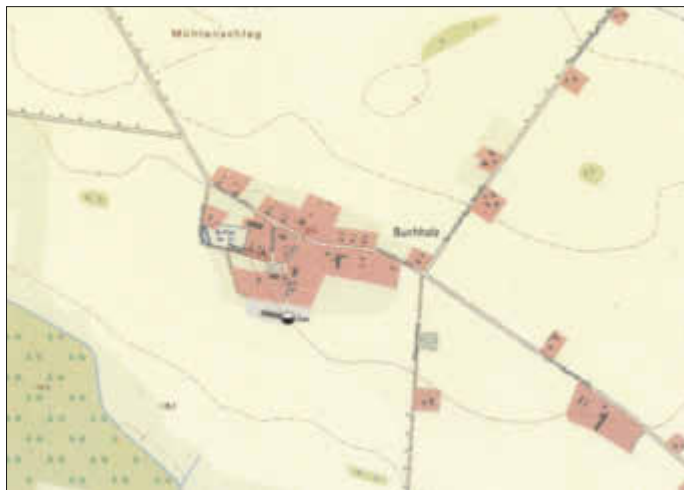
Übersichtsplan mit Räumlichen Geltungsbereich des B-Planes

Nach § 10 Abs. 2 BauGB bedarf der selbständige Bebauungspläne nach § 8 Abs. 2 Satz 2 der Genehmigung des Landkreises Vorpommern-Rügen.