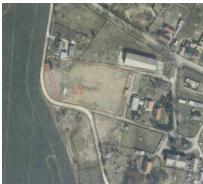
Luftbild 04/2019 mit Räumlichen Geltungsbereich des B-Planes

Damit wird auch ein Beitrag zur Entwicklung der Gemeinde und zum Umweltschutz geleistet.