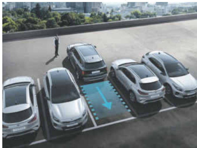
Einparken leicht gemacht: Fahrerassistenzsysteme sorgen für mehr Sicherheit am Steuer.

(djd). Kleine Unachtsamkeiten können im Straßenverkehr kostspielige Folgen haben. Gerade beim Einparken kommt es schnell zu ärgerlichen Blechschäden am eigenen und an anderen Autos. Noch fataler ist es, wenn beim Rangieren Fußgänger oder Radfahrer übersehen werden. Elektronische Helfer, sogenannte Fahrerassistenzsysteme, machen den Alltag am Steuer sicherer und bequemer. Neufahrzeuge wie der Kia Sorento verfügen über eine Vielzahl an Co-Piloten, die den Fahrer bei Gefahren warnen oder im Fall der Fälle sogar schneller bremsen können als der Mensch. Selbst enge Parklücken haben ihren Schrecken verloren. Mit dem Remote-Parkassistent muss sich der Fahrer nie wieder über zugeparkte Türen ärgern - zum Vor- und Zurückrangieren genügt in Zukunft ein Knopfdruck auf den Fahrzeugschlüssel.