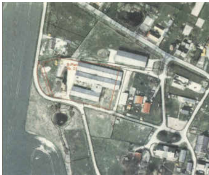
Luftbild 2007 mit Räumlichen Geltungsbereich des B-Planes

Die Fläche war bis 2008 mit Stallanlagen komplett bebaut und ist heute nach dem Abbruch der Gebäude unbebaut.